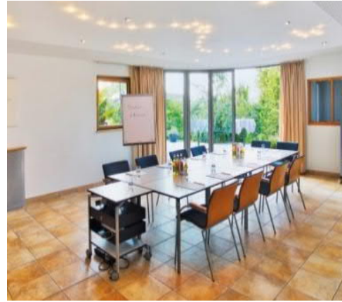
Wiesengrund & Weinsberg

Diese Räume eignen sich hervorragend für Ihre Kinderbetreuung, für Spiele oder Aktionen mit Ihren Gästen.